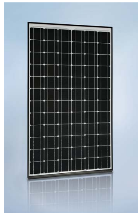
SCHOTT MONO™ 180/185/190